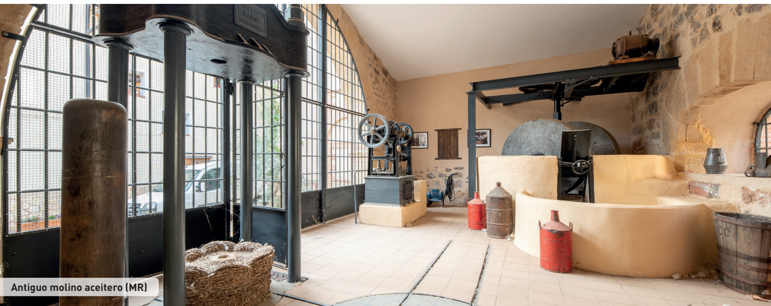
Antiguo molino aceitero (MR)

Berge destaca también por haber integrado mediante su restauración museística la antigua almazara ubicada dentro del casco urbano. Este molino que recibió el nombre de Cooperativa del campo de Berge, se fundó en el año 1948 (hasta entonces sólo funcionaba el molino aceitero de Pallarés, en la actualidad en ruinas), y estuvo en funcionamiento hasta mediados de los años noventa. Fue entonces cuando sus más de cien socios, ante las adaptaciones que en ese momento se exigían, decidieron integrarse en la actual cooperativa de Alcorisa. El espacio restaurado del antiguo molino guarda una parte importante de la historia de Berge, pudiendo visitarse para contemplar la maquinaria conservada que se utilizó en su día y que gracias a esta actuación municipal se mantiene viva en la memoria de sus vecinos.