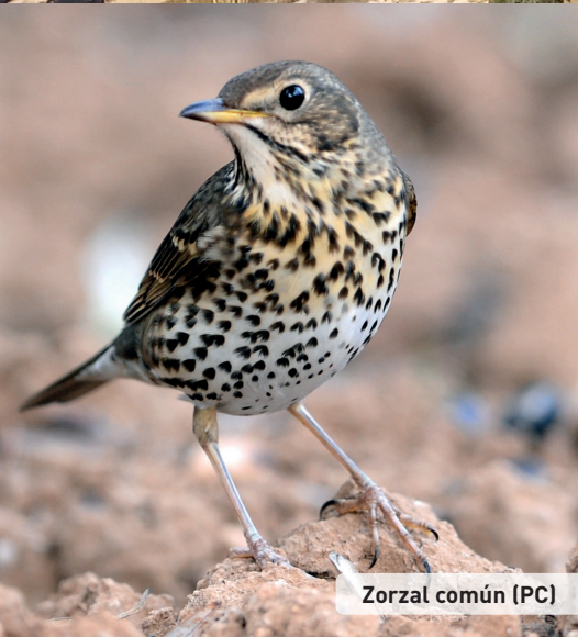
Zorzal común (PC)