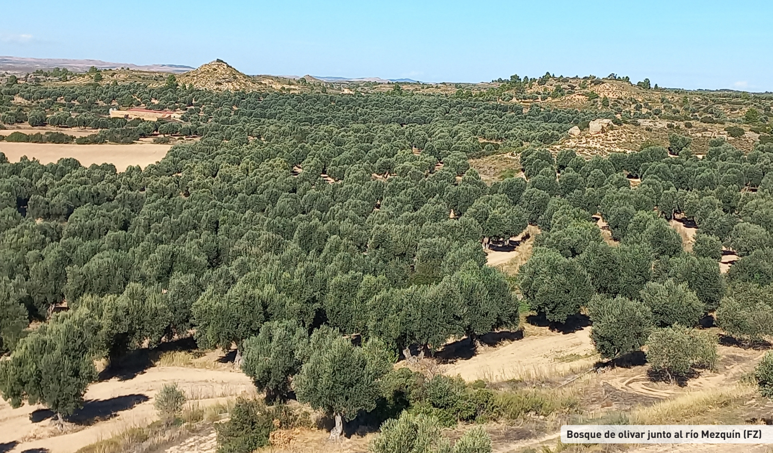
Bosque de olivar junto al río Mezquín (FZ)